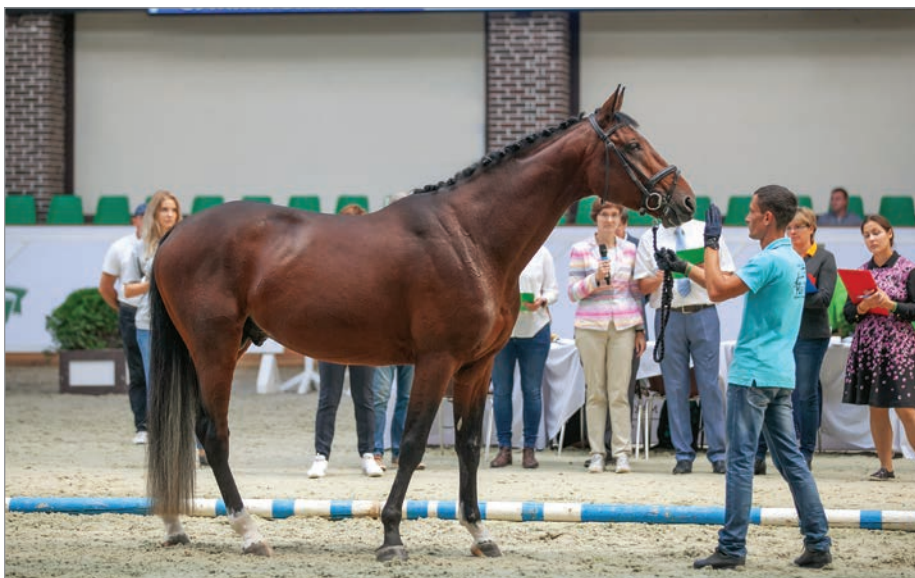
Демонстрация племенной продукции на выставках – обязательный элемент селекционной работы: там можно получить оценки независимых судей и показать товар лицом.